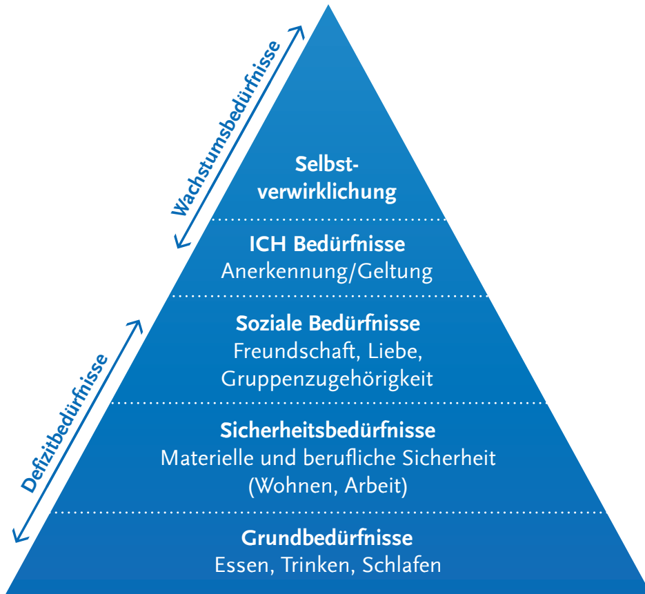
Bedürfnispyramide nach Abraham Harold Maslow (1908 - 1970)

Die Befriedigung der menschlichen Grundbedürfnisse ist für das körperliche, seelische und geistige Wohlbefinden der Menschen grundlegend und dient der Entfaltung der Persönlichkeit.